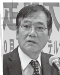
挨拶に立つ西野内部部長