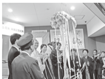
式典で挨拶を述べる門川京都市長