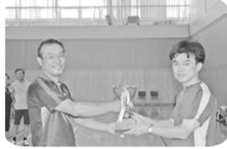
前回優勝九条Aチームより優勝カップ返還