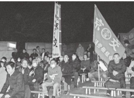
結集した京交組合員

た。尚、終了後、予定されていたデモ行進は東日本大地震の発生により中止となりました。