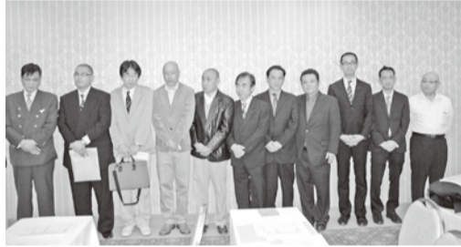
今回退任した役員