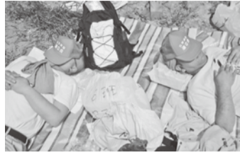
お昼休憩、束の間の休息

当初は不安ばかりが募り、被災された方に少しでもお役に立てればとだけ思いながら岩手県の被災地へボランティア活動に参加した。私たちが拠点となる千厩ベースキャンプは被害も少なく、ガス・水道も問題なく使用でき、朝・昼・晩の食事も物足りなさはありません。実際の指揮を執るボランティアセンターまではベースキャンプからバスで30分の場所であり、そこで作業の指示をうけてから現場までバスで移動します。現場に向かう道中、徐々に津波の影響で被害に遭われた家屋・車が目に入ってきた時には言葉になりません。作業現場は想像していた以上に家の倒壊が激しく、車やトラックが粗大ゴミの様で散乱し、一面が田んぼだらけの状態でした。私たちは田んぼ一面に広がった瓦礫や木材、壁、電線、衣類、ビニールなどなど手作業で分別して、所定の位置まで運ぶ単純作業でありましたが慣れないこともあり重労働に感じました。作業中、瓦礫の中から子供がお風呂で遊ぶおもちゃを手にとった時、こみ上げるものが一瞬手が止まりました。あんなにぐっとこらえて作業を終る日々でありました。また、気仙沼港の辺りは報道があつたように被害が酷く、船が打ち上げられていたり、土産屋は営業の目途がたず建物だけが残っている状態。魚の腐敗で臭いも凄かったです。そのような中でも駐車場には他府県ナンバーの車が止まっており、車中泊でボランティア活動する一般の方が多く見受けられました。なかにはキャンピングカーで長期にわたりボランティア活動される方もおられ、駐車場の簡易の銭湯を設営して利用されておりました。今回、ボランティア