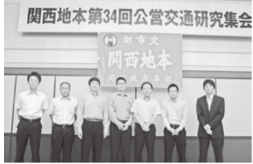
参加した教宣部員