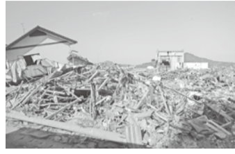
目の当たりにした現状

当初は不安ばかりが募り、被災された方に少しでもお役に立てればとだけ思いながら岩手県の被災地へボランティア活動に参加した。私たちが拠点となる千厩ベースキャンプは被害も少なく、ガス・水道も問題なく使用でき、朝・昼・晩の食事も物足りなさはありません。実際の指揮を執るボランティアセンターまではベースキャンプからバスで30分の場所であり、そこで作業の指示をうけてから現場までバスで移動します。現場に向かう道中、徐々に津波の影響で被害に遭われた家屋・車が目に入ってきた時には言葉になりません。作業現場は想像していた以上に家の倒壊が激しく、車やトラックが粗大ゴミの様で散乱し、一面が田んぼだらけの状態でした。私たちは田んぼ一面に広がった瓦礫や木材、壁、電線、衣類、ビニールなどなど手作業で分別して、所定の位置まで運ぶ単純作業でありましたが慣れないこともあり重労働に感じました。作業中、瓦礫の中から子供がお風呂で遊ぶおもちゃを手にとった時、こみ上げるものが一瞬手が止まりました。あんなにぐっとこらえて作業を終る日々でありました。また、気仙沼港の辺りは報道があつたように被害が酷く、船が打ち上げられていたり、土産屋は営業の目途がたず建物だけが残っている状態。魚の腐敗で臭いも凄かったです。そのような中でも駐車場には他府県ナンバーの車が止まっており、車中泊でボランティア活動する一般の方が多く見受けられました。なかにはキャンピングカーで長期にわたりボランティア活動される方もおられ、駐車場の簡易の銭湯を設営して利用されておりました。今回、ボランティア