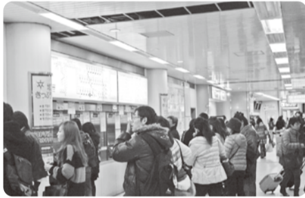
京都駅中央1番券売機付近