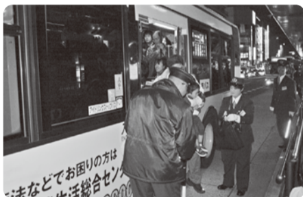
京都駅降り場では感謝表明と運賃収受にあたる