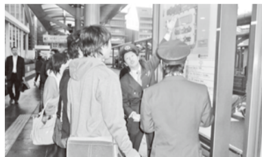
身ぶり手ぶりを交え、丁寧な案内をしました