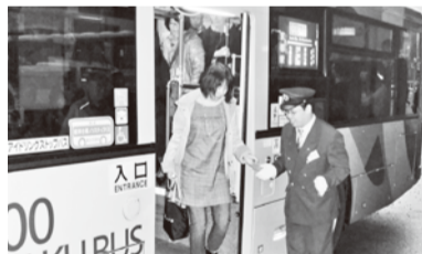
カードの日付確認もバッチリ