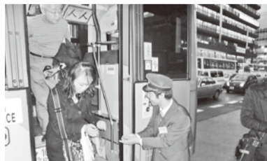
運賃は両手で受け、感謝表明も忘れず!

二〇一一年十一月十九日・二十日の二日間、青年女性委員会のメンバー二十二名が参加して秋の行楽シーズンに対応するエンパワメント活動に取り組みました。当初、東山三条に於いてバスから地下鉄への振替輸送時に案内活動を行う計画でしたが、十九日は降雨の影響でお客様も例年に比べ少なく、東大路通りの渋滞が発生しなかったことから振替輸送は実施されませんでした。そこで、急遽活動場所を京都駅に移し、各観光地のライトアップを見学されるお客様に対し、地下と地上に分