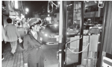
暗い足下にも注意喚呼しました