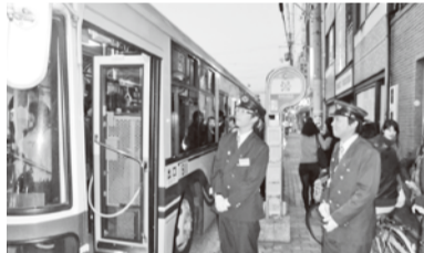
東山三条で案内活動