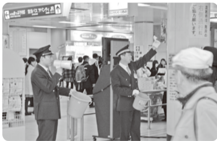
振替乗車のお客様を団体ゲートに誘導