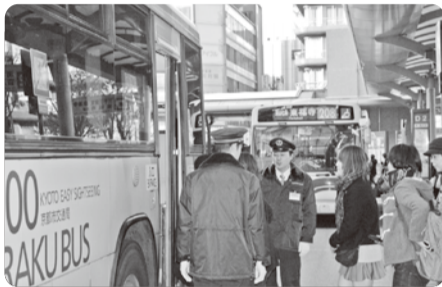
乗車時の注意喚起も忘れずに行いました