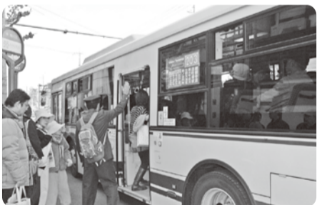
銀閣寺道でもお客様の安全確保につとめました