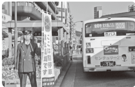
塩小路は効果抜群の幟で違法駐車対策