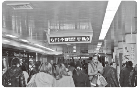
賑やかな四条駅コンコース