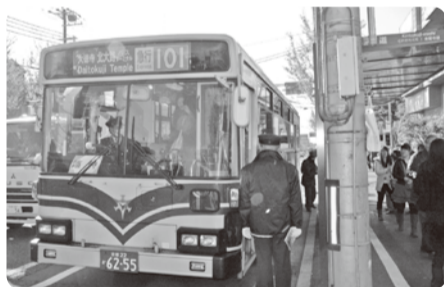
金閣寺道バス停多くのお客様をお運びしました