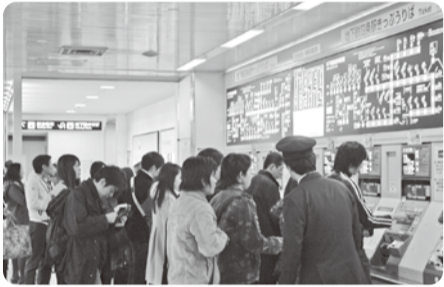
四条駅北券売機付近