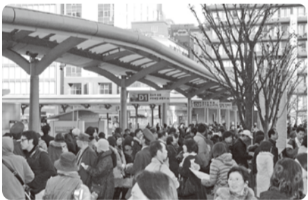
観光客で溢れかえるバス乗り場