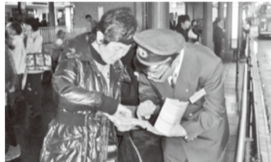
案内はお客様目線で行いました