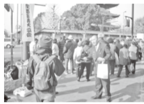
九条大宮交差点で積極的に行動しました

九条支部では、毎月恒例の交通安全教室を開催しています。交通安全教室では、交通安全の重要性を学び、安全運転の心がけを促しています。 交通安全教室では、交通安全の重要性を学び、安全運転の心がけを促しています。また、地域の交通安全活動にも積極的に参加しています。 交通安全教室では、交通安全の重要性を学び、安全運転の心がけを促しています。また、地域の交通安全活動にも積極的に参加しています。