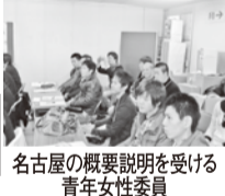
名古屋の概要説明を受ける青年女性委員

二〇一一年度 関西地本青年女性セミナー in 名古屋は、十二月八日(木)九日(金)、都府交関西地本二〇一一年度青年女性セミナーとして開催されました。冒頭、関西地本田中書記長から新年度の挨拶と、各支部の活動報告が行われました。 セミナーでは、交通安全の重要性を学び、安全運転の心がけを促すとともに、各支部の活動報告が行われました。また、交通安全教室を開催し、交通安全の重要性を学び、安全運転の心がけを促しています。 交通安全教室では、交通安全の重要性を学び、安全運転の心がけを促しています。また、地域の交通安全活動にも積極的に参加しています。