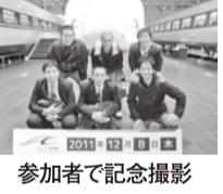
参加者で記念撮影

二〇一一年度 関西地本青年女性セミナー in 名古屋は、十二月八日(木)九日(金)、都府交関西地本二〇一一年度青年女性セミナーとして開催されました。 セミナーでは、交通安全の重要性を学び、安全運転の心がけを促すとともに、各支部の活動報告が行われました。また、交通安全教室を開催し、交通安全の重要性を学び、安全運転の心がけを促しています。 交通安全教室では、交通安全の重要性を学び、安全運転の心がけを促しています。また、地域の交通安全活動にも積極的に参加しています。