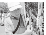
温度計は38を指していました