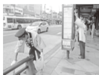
バス停は勿論きれいに

二〇一二年七月一日(火)夕方五時より、四条大宮から祇園八坂神社までの約二・五kmの清掃活動を実施しました。当日は気温三〇度を超える暑さの中での取組みとなりましたが、京都のメインストリートである四條通が景観だけでなく歩道や道路もきれいであり続けるよう願いを込めて、双方向から南北に分かれて丁寧な清掃を行いました。途中、暑さでバテ気味となりましたが、バス待ちのお客様や周りの方から励ましの言葉をかけていただくことで清掃活動に力が入りました。また、法被を着ての取組みとしたため、観光客の方から観光地へのルートを数多く尋ねられ、笑顔を交え親切・丁寧に対応し、交通局のイメージアップに貢献しました。終了後の意見交換でも、「いつもと違う形でお客様に接することが出来て良かった。」