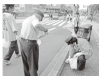
目立つゴミはひとつ残らず拾いました

「青年女性委員会の存在をアピール出来た。」と、委員の中でも前向きな意見が多く出されました。今後も、公共交通存続のため、地道な活動をコツコツと積み重ねていきたいと考えていますので、ご協力をお願いいたします。