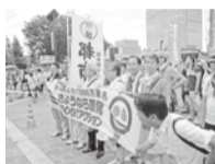
代々木公園から元気づく出発

その後、大規模なパレードが原宿・渋谷・新宿の三コースで行われ、都市交は渋谷コースに参加し、「さようなら原発一〇〇万署名」の実現を目指して「原発反対」「再稼働を許さず」など、シユプレビコールを高らかに叫びながら恵比寿まで約三キロを行進しました。本日に暑い一日でした。