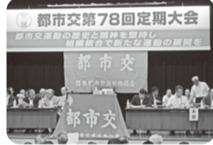
都市交第78回定期大会の様子

「路面電車事業の方向性で本部から直営での事業維持・存続を訴えていた。引き続き、ご指導・ご支援をお願いいたします。」と述べられました。続いて、二〇一一年度会計報告が行われ、同会計監査報告を佐田本部会計監査が行い承認され、午前の部最後に第