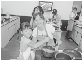
カメラを向けると笑顔です