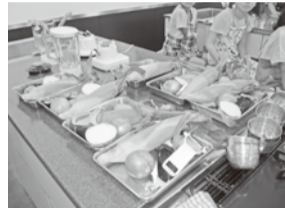
・・・材料です・・・