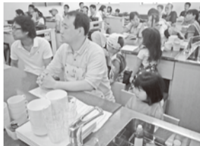
先生の説明はちゃんと聞きました