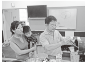
パパ家でも作ってね!