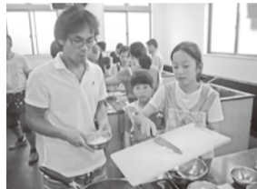
娘は立派になったなあ