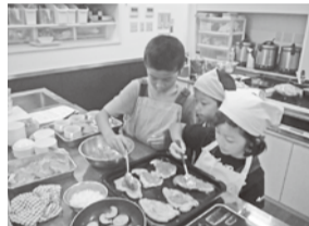
子どもたちも真剣です