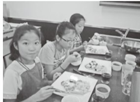
お腹ペコペコなんです