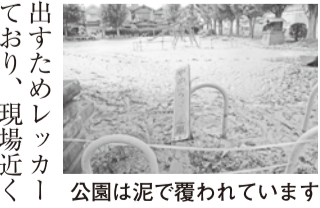
公園は泥で覆われています