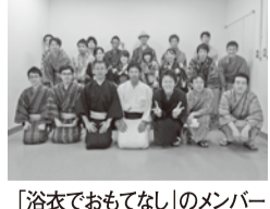
「浴衣でおもてなし」のメンバー

平成二十四年七月十六日(月・祝)の祇園祭宵山の日、京都駅及び烏丸御池駅の改札口を中心に、総勢二十一名で、本局支部エンパワメント活動を行いました。例年行っている活動であり、浴衣姿という柔らかな装いで、祇園祭に来られたお客様への案内及び誘導等を行いました。活動当日は、祝日と宵山の日が重なり、非常に多くの人で賑わったため、駅の混雑緩和等に貢献するとともに、京都のまちに不慣れなお客様に対して、的確な案内をすることができ、大変有意義な活動となりました。また、祇園祭に来られていたお客様は、普段とは違う装いに対して、関心を持たれていました。本局支部では、今後も引き続き、このような地道な活動を続けていくことで、自分たちの職場は自分たちの力で守っていきたいと思っております。