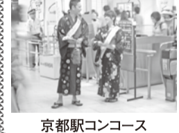
京都駅コンコース