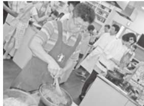
シェフではありません