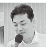
烏丸線乗務支部 朝田副支部長 一〇〇周年記念フェスタについて②水族館開業に伴う乗客増について③産別統