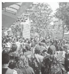
混雑する市バスDのりば