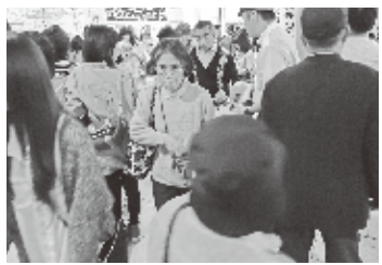
～地下鉄京都駅券売機前～