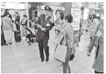
地下鉄四条駅で丁寧にご案内