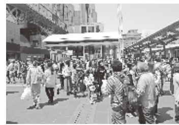
京都駅丸九口からバスのりばまで大混雑