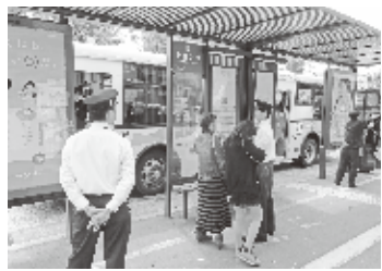
・・・金閣寺道・・・