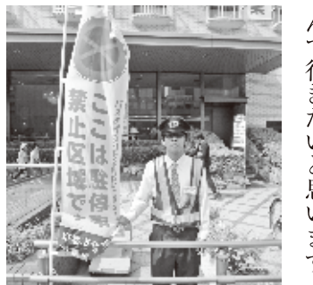
違法駐車車両監視の組合員

青年女性委員会はエンパワメント活動として、二〇一三年五月三日(金)から五日(日)の三日間、春の都大路作戦に参画しました。昨年は、東山三条での振替輸送の案内活動に取り組みましたが、今回は、京都駅の塩小路通りの路上駐車監視を行いました。この通りは、日頃、駐車禁止区域にもかかわらず違法駐車が非常に多く京都駅前の渋滞の悪化に繋がっているとともに、市バスの運行に支障をきたしています。活動した三日間とも天気は快晴で、渋滞の予想もされていましたが、予想よりも目立った渋滞はありませんでした。しかし、監視に立つことにより少しは違法駐車車の軽減に繋がったと感じています。今後も、継続して取り組みで行きたいと思えます。