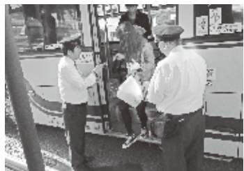
バスターミナルタ方料金受け