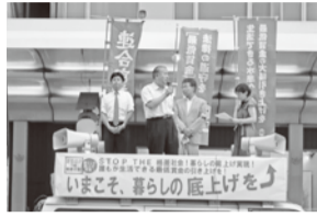
街宣車から訴えかける