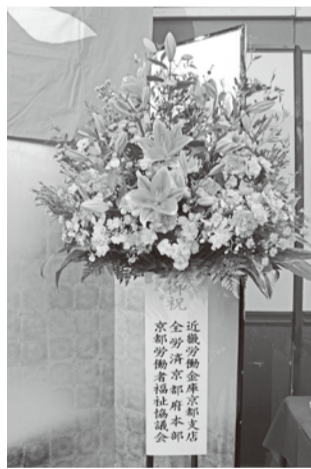
～定期大会に華を添えた花～