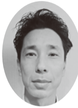
烏丸線乗務支部 進高 代議員

定期大会に初めて参加させて頂き緊張感の中、来賓の方もたくさん来られており、大変活気ある大会でした。今後の組合活動に生かしていきたいと思えます。