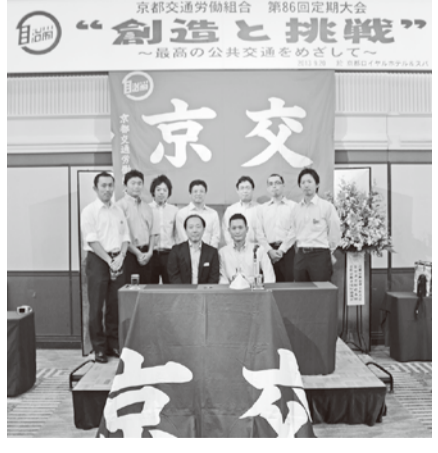
定期大会の取材を担当した教宣部一同