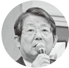
京都市公営企業管理者 西村 隆 交通局長