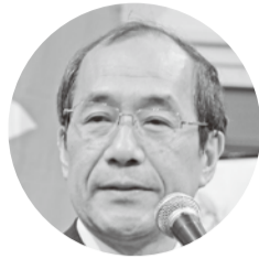
門川大作 京都市長