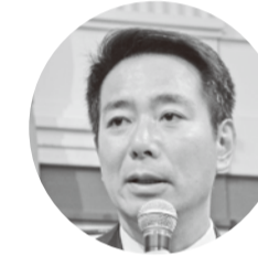
前原誠司 衆議院議員