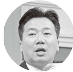
福山哲郎 参議院議員