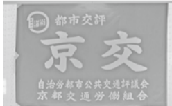
新調された「都市交評」旗