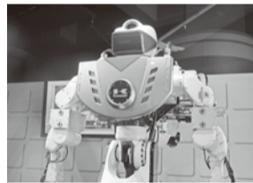
パフォーマンスロボット