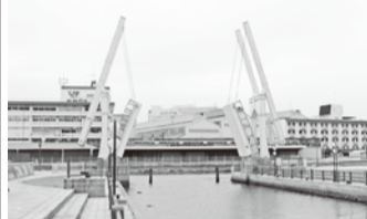
ハーバーランド広場の中央にある「はな橋(はなっこ)」