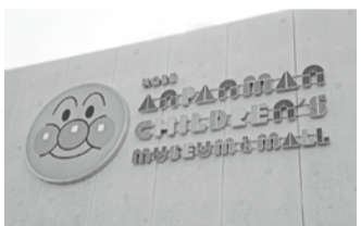
全国で4カ所目、西日本初