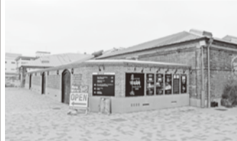
神戸煉瓦倉庫周辺

毎年多くの組合員と家族が参加する、京交社会保障部主催の日帰りバスツアーが今年も十月十二日(日)の第一陣を皮切りに十一月十日(日)まで、六班に分けて総勢三七〇名の皆さまが参加して開催されました。今年度は、「物語のある港町神戸日帰りバスツアー」と題して、「海洋博物館・カワサキワールド」見学とミュージックグルメ船「コンチェルト」で豪華な中華バイキングに食べ飲み放題という、ちよびりりッチな内容となりました。また、自由時間を設定し、二〇一三年四月十八日にリニューアルオープンしたショッピングモール「umie MOSAIC」でショッピングを楽しんだり、四月十九日に開業した「アンパンマンミュージアム」でお子様と遊んだり、みなさん有意義に自由時間を過ごされています。今回のバスツアーは、絶好の行楽日和の日もありましたが、移動距離が短いということも、参加された皆様への協力もあって、時間とお金の行程消化となりました。ご参加いただきました組合員の皆さま、ご家族の皆さま、世話役を務めた役員の方々の皆さま、ありがとうございます。今後も皆さまに喜んでいただけるレクレーションを企画していきますので、ご参加お待ちしております。