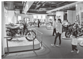
モーターサイクルギャラリー