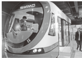
低床電池駆動路面電車「SWIMO」