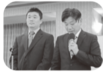
エンパワメント活動報告 東西線乗務支部

十一月二十七日(水) 十四時からアークホテル京都に於いて、年内最後となる京交第... 三回中央委員会が開催された。冒頭、瀬戸執行委員長から「①都市交解散について②自治労との産別統合について③各種選挙について④台風十号における対応について⑤市労連確定交渉について」等、今年一年を振り返った。続いて、団体交渉やエンパワメント活動などの報告事項並びに二〇一三年度第1四半期の決算報告及びレクレーション開催等の議案について審議され、それぞれ確認された。また、再任用制度導入にかかる賃金労働条件の交渉や、自動車部が毎年実施している「全車ピカピカ宣言」のエンパワメント活動が控えていることから、健闘を誓い合い、年内最後の中央委員会を締め括った。