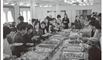
中華バイキングを堪能しました

神戸海洋博物館 神戸海洋博物館は神戸開港二〇〇周年記念事業として、一九八七年に開館し二〇〇五年四月「海から港から神戸が始まり、未来に船出する」を新たなコンセプトとしてリニューアルオープンしました。「現代から未来の神戸港」と二つのコーナーに大別し、神戸開港の中心とした、海・船・港の昨日・明日を分かりやすく展示している博物館です。 カワサキワールド 神戸港とともに歩んできた川崎重工業の創業以来の歴史から、製品紹介まで、見て・聞いて・体験する、大人から子どもまで楽しめる博物館で、初代0系新幹線やヘリコプター、モーターサイクル等の実物展示を通じ、事業を紹介していきます。 〔参加者の声〕 ・楽しかった。また行きたい!もつと遊びたい(隣の子どもの声) ・この値段で安い(主催者が一部負担しています) ・料理が美味しいし、メニューもたくさんあって満足でした。