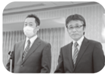
エンパワメント活動報告 西賀茂支部