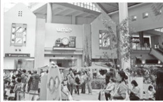
ショッピングモール「umie」