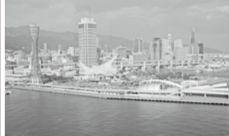
ハーバーランドから神戸市内を望む