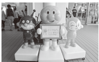
アンパンマンテラス