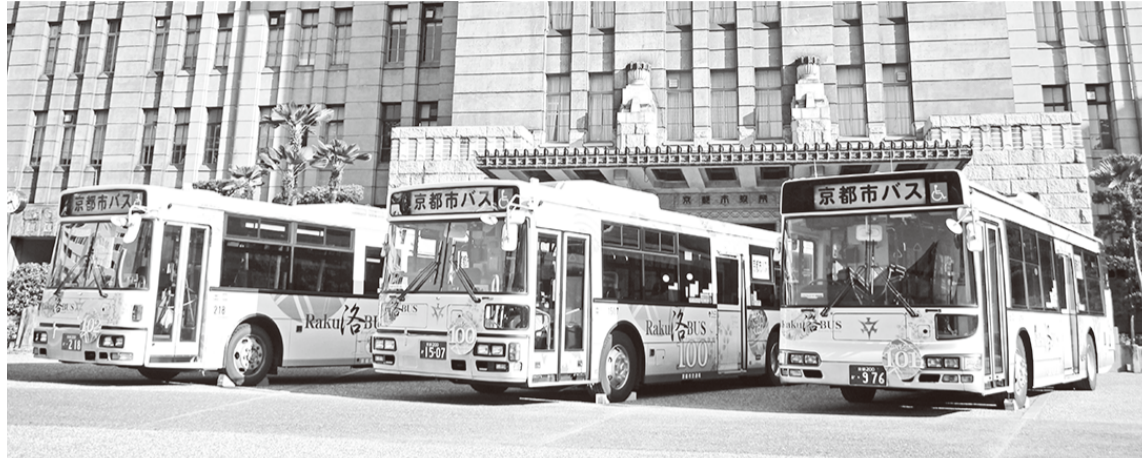
= 新デザイン洛バス =

平成26年3月11日(火)午前9時から京都市役所前広場に於いて洛バス新デザインお披露目式典が開催されました。自動車6支部は、式典開催に合わせ新洛バスのヘッドマークをモチーフにした缶バッジを製作し、当日来場されたお客様や市民の方々にお配りし、新洛バスのPR活動に努めました。