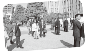
缶バッジ配布の様子