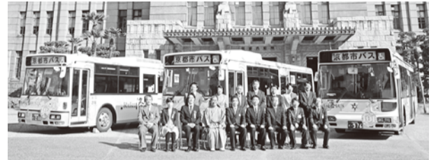
= 式典の来賓者 =