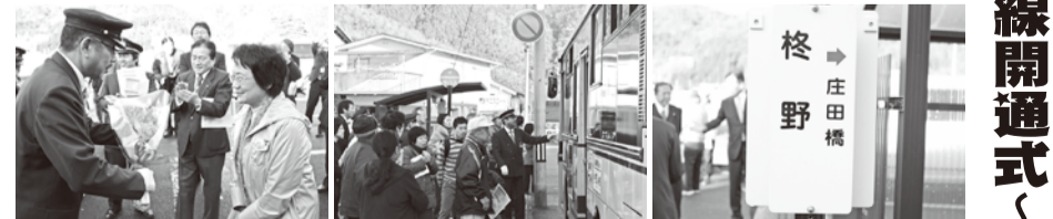
地元の方から足立烏丸支部長に花束贈呈 ♪ 地元では大歓迎 ♪ 特37号系統運行スタート

三月二十二日(土)、新運転計画において従来の特37号系統の路線が西賀茂営業所より北側の志久呂橋、柘野地域に延長され新規路線として開通しました。地元住民の強い要望路線とあって、開通一番バスには沢山の乗客様がご乗車されました。当日は、新規開通に伴い柘野バス停にて開通セレモニーが行われ、北区選出の市会議員の方や地域住民の方も多数参加され賑やかに行われました。近所にお住まいのお年寄りの方からは「いつも西賀茂車庫まで歩いてバスに乗りに行っていたのが便利になった」と喜んでおられたのが印象的でした。