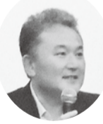
自治労本部書記長 森書記次長

初めに、主催者として、自治労本部から森書記次長が挨拶をされ、①自治労の労働運動について②人事員勧告の動向③地方公務員制度の改正について述べられた後、今回の情報セミナーの内容を説明され「各単組に持ち帰り、機関紙作りに活用して下さい」と括られました。 次に全体集会として「どうせやるなら楽しくやろう、機関紙づくり」をテーマにレーベ