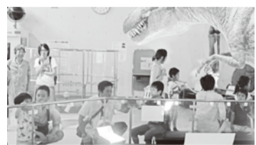
▶▶ 体験の様子 ◀◀