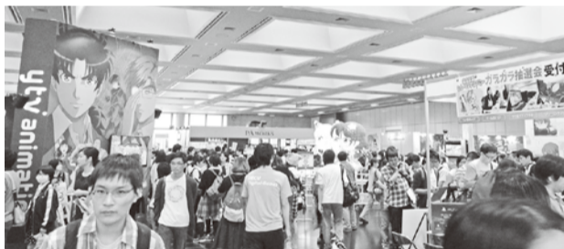
～京都国際マンガ・アニメフェア(京まふ)会場の様子～