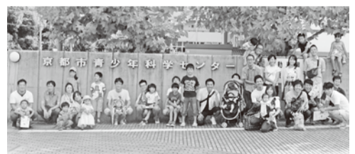
▶▶ 参加者全員で ◀◀