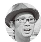
挨拶された足立支部長