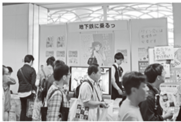
～「地下鉄に乗るっ」ブース～

順番にパレードをして、会場は大変盛り上がりつつありました。市電のカラーは、年配の方には懐かしかったようで身を乗り出して写真を撮られていました。次に、京まふの会場に移動し「地下鉄に乗るっ」のブースへ行くのと物販を求めて多くの人で賑わっていました。市バス・地下鉄応援キャラクターの宣伝効果は確実に出てきているように思いました。今後も、色々なイベントに参加して利用促進をPRして欲しいと思います。