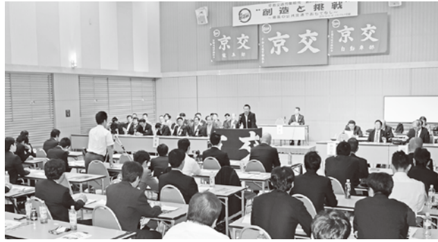
・・・ 会場の様子・・・