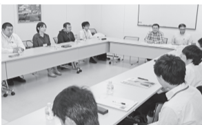
・・・研究会の様子・・・