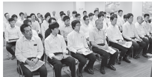
～真剣に聞き入る新人組合員～