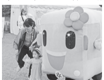
・・・ハイチーズ・・・

2017年5月14日(日)京都市営地下鉄沿線で営業するパン屋の自慢のパンを集めた「母の日 地下鉄パンまつり」が京都府立植物園で開催されました。「母の日」に植物園の無料開放に合わせたイベントで、地下鉄若手の利用促進などを目的に京都市地下鉄東西線の職員増客チームが企画。烏丸線と東西線の間、駅から徒歩15分以内にある17店舗が園内の芝生の広場で、それぞれ、自慢のパンを販売されました。交通局ブースには京ちゃん、都くんが登場し来園者に握手や記念撮影に応じていました。また、多くのパフォーマーも参加し会場を盛り上げていました。当日は天候にも恵まれ、多くの家族連れが賑わい、お目当てのパンを購入したほかに長蛇の列が見られました。1時間ほどで完売したパンもあったそうです。賀文さんは「普段はなかなか行けないので、親子で良い時間を過ごせました」と喜んでおられました。佐藤 真 教宣部員