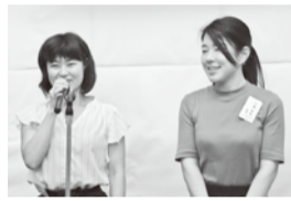
～単組紹介を行った～