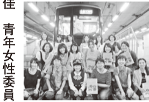
～参加者でハイヒーズ～

いることについて説明を受けました。また、乗務員もあまり体験しない洗車が体験でき、日頃、営業している電車しか乗っていない参加者から「大変貴重な体験になった」と好評でした。