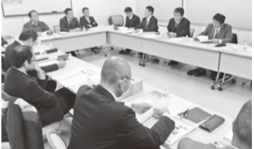
・・・会議の様子・・・