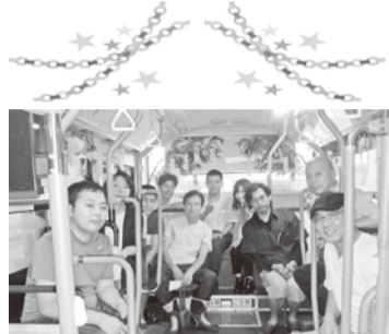
飾り付けを行った西賀茂支部役員と組合員

二〇一八年七月六日(金)西賀茂営業所三二六号車の「NISHIJIN BUS」をお客様に楽しく喜んでご乗車頂けるように、支部役員を中心として、十二人、心をこめて、車内に七夕飾りつけを行いました。このバスは京都市大宮保育園の子供たち約一〇〇人の願いが書かれた短冊や笹飾りなど七夕の装飾を施し「京の七夕 NISHIJIN BUS」として八月一日(水)から開催される京都の夏の風物詩「京の七夕」に先立ち、イベントを開催する。掘川会場と鴨川会場を通る市バス九号系統、三十七号系統で七月七日(土)から八月十六日(木)まで運行します。ぜひご乗車下さい。