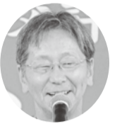
講演された 加納職員労働組 合執行委員