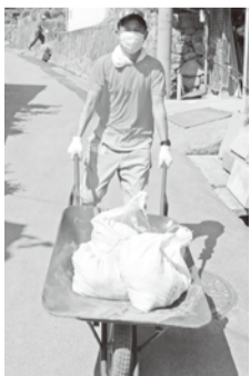
一輪車で運び出した。