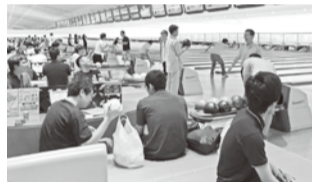
●ボウリングを楽しむ組合員●

電整支部では、職場の連携強化と組合員の親睦を深めるため2018年7月13日(金)MKボウル上賀茂で、ボウリング大会と懇親会を行いました。ボウリングは、職場や世代を超えて大変盛り上がり、懇親会のガーデンバーベキューでは職場の話題や、組合活動に関する意見なども出て非常に有意義な時間となりました。普段は、組合員同士が接する機会が少ない支部ですが、去年より参加者が増え27人となり、交流を持つ良い機会となりました。今後も、このような活動を通して支部強化を図っていきたく思います。