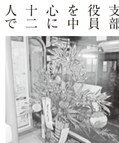
細やかな飾り付けを行った