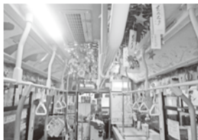
～賑やかな飾り付けの車内～