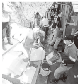
・・・狭い場所での活躍・・・