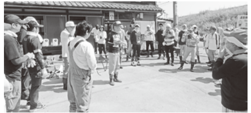
・・・現地で作業説明を受けるボランティアグループ・・・