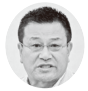
挨拶に立つ 瀬戸都公共交通評議会 議長(京交執行委員長)

古資料館に展示されている が、もっと多くの人に見て らえるように今後は展示方 を工夫する、と締めくくられ た。その後、質疑応答があり、 参加者の現在の住まいや職 場の地層から何が発掘され たか、質問があった。次に前 原誠司衆議院議員が「国政の 現状と世界情勢について」講 演され、昨年の衆議院議員解 散選挙か らの経緯 と、来年 の参議院 議員選挙 と統一地方選挙への見通しに ついて講演された。その後、 ①強大化する中国とどう付き 合うか②なぜ人口減少に歯止 めがかからないのか③成長を 前提とする「アベノミクス」 は国民を 幸せにし ない④消 費税を国 民負担率 五〇%ま で引き上 げ、「A F or A F 社会」を実現すると締め くくられた。その後、懇親会 が開催となり、意見交換など 有意義な時間を過ごし研修会 が閉会した。