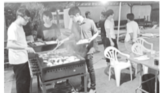
●バーベキューで懇親を深めた●