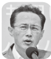
廣岡連合京都会長