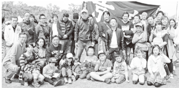
〰〰〰 烏丸支部 〰〰〰