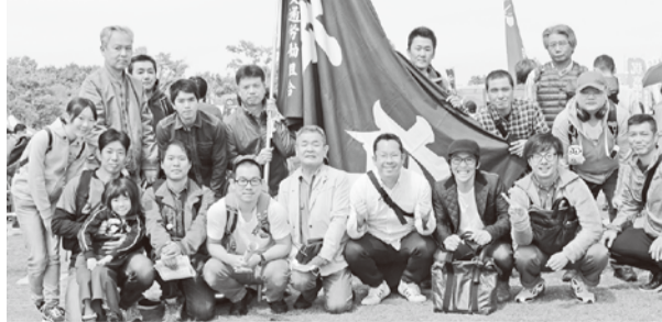
〰〰〰 駅務支部 〰〰〰