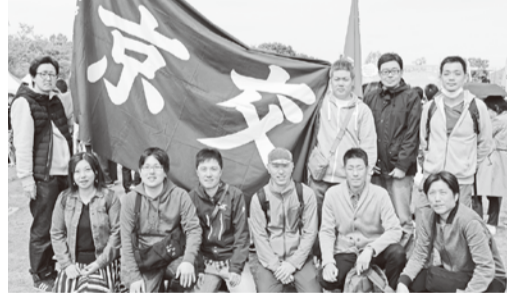
〰〰〰 東西線乗務支部 〰〰〰