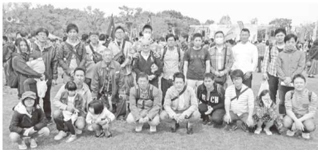
〰〰〰 九条支部 〰〰〰