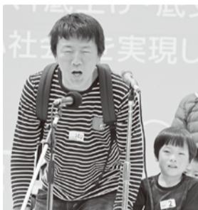
・・・大声コンテスト・・・