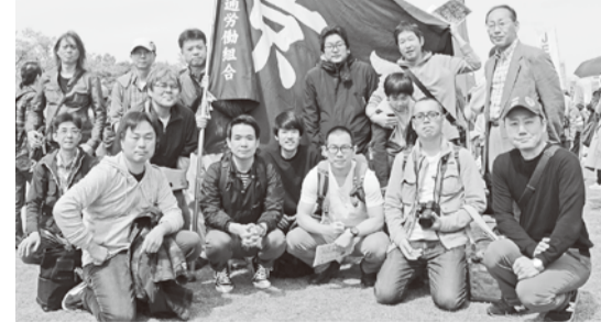
〰〰〰 電整支部 〰〰〰