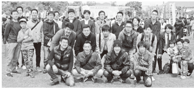
〰〰〰 梅津支部 〰〰〰