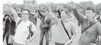
〰〰 団結ガンバろう!! 〰〰