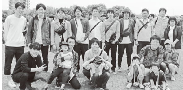
〰〰〰 本局支部 〰〰〰