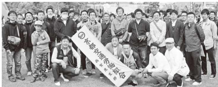
〰〰〰 西賀茂支部 〰〰〰