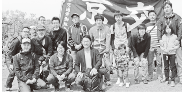
〰〰〰 烏丸線乗務支部 〰〰〰