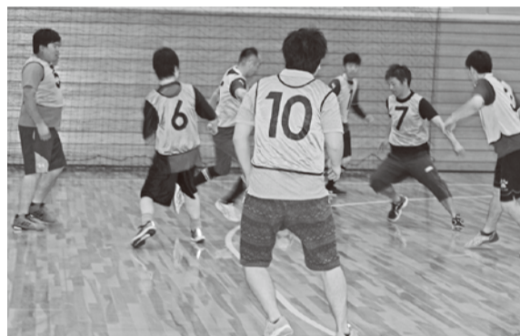
激しくボールを奪い合う