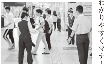
・・・ チラシを配る様子・・・