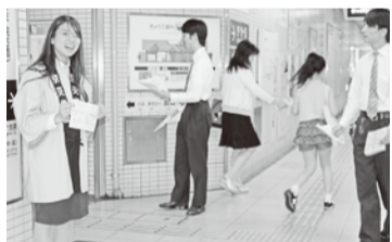
・・・ 声かけをする青年女性委員・・・

青年女性委員会では、初の試みとして、お客様に「安心・安全・快適」に「市バス・地下鉄」をご利用いただくために、マナー啓発関係で何かできないか案を出し合い、わかりやすくマナー啓発をするため、チラシを自分たちで作成する事にしました。今回は、学生中心に「市バス・地下鉄」を利用する時のマナーについて知っていただくため、イラストを交えました。また作成するだけでなく、お客様に直接手渡しをするエンパワメント活動を五月二十四日の夕方、青年女性委員十八名が参加し、国際会館駅・北大路駅の駅構内で行いました。祇園祭期間の清掃活動とともに青年女性委員会の恒例活動となるよう活発な委員会活動を進めていきたいと考えています。今後とも青年女性委員会の活動にご理解、ご協力をお願い致します。