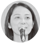
増原ひろこ参議院議員京都選挙区予定候補者