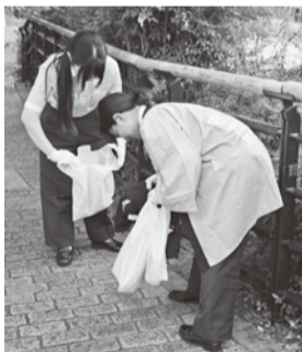
～ 清掃活動 ～

七月二五日(木)、一七時から四条通の清掃活動を二五名(うち四名女性)で行った。湿気が高く、高温となる中、祇園から四条大宮間を四グループに分けて、歩道のゴミ拾いとバス停の拭き掃除に取り組んだ。観光客の増加から、例年に比べ、ベトロボトなど資源ごみが多くあり、すぐにゴミ袋はいっぱいとなった。バス停では、注意書きシールの剥れを整えるなど、例年以上に丁寧に取り組んだ。また、お客様に行き先を案内するなど、清掃以外の経験もでき、大変貴重な経験となった。今後も、青年女性委員会では、積極的にこのような活動に取り組んでいきますので、ご協力よろしくお願います。