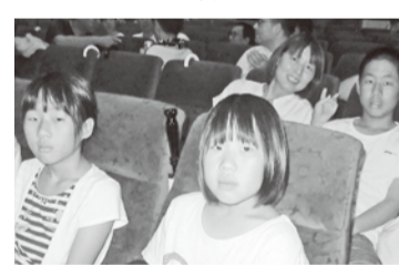
… っこり笑顔! …