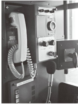
… 列車無線と放送装置 …

八月二二日(木)、烏丸線新造車両の導入に向けて、神戸市交通局の新造車両六〇〇〇形を見学するため、電車部一六名で名谷車両基地を訪ねた。今年四月から営業運転を行っている車両は、これまで以上にバリアフリー化と快適性を向上させ、安全性を高めた省エネ化にも力を入れた設計となっており、参考にするところは多くあった。初めに、車内を明るく見せる工夫など、車両についての概要説明を受け、室内の状況や、床下機器、運転席の配置などを実車で確認した。また、運転指令と乗務区を見学した後、意見交換会を行った。その場では「デジタルメーターは反応が遅い」といった新システムの使い勝手や、導入にあたっての注意点など貴重なアドバイスを頂いた。この間、電車部では新造車両の導入決定後、甲側との連絡を密に取り、適宜仕様についての協議を重ねてきた。昨年には東京メトロの新造車や西武鉄道のバリアフリー化対策、横浜市交通局でのホーム柵の運用を視察し、最新の車両設備や安全装置について、しっかりと情報共有を行ってきた。今後の詳細設計にでも、安全で使いやすい車両となるよう、今回の視察での経験を大いに生かしていきたい。