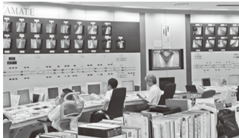
… 運転指令区 …