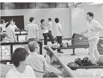
… 盛り上がる組合員! …