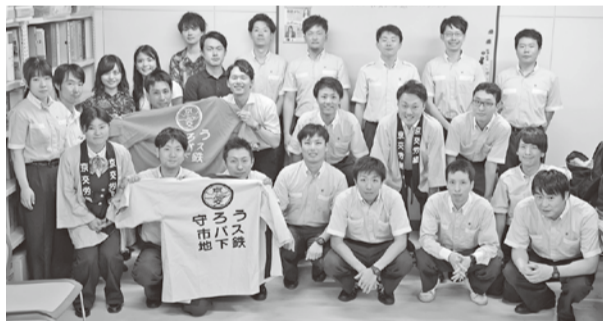
～ 参加者全員で ～

七月二五日(木)、一七時から四条通の清掃活動を二五名(うち四名女性)で行った。湿気が高く、高温となる中、祇園から四条大宮間を四グループに分けて、歩道のゴミ拾いとバス停の拭き掃除に取り組んだ。観光客の増加から、例年に比べ、ベトロボトなど資源ごみが多くあり、すぐにゴミ袋はいっぱいとなった。バス停では、注意書きシールの剥れを整えるなど、例年以上に丁寧に取り組んだ。また、お客様に行き先を案内するなど、清掃以外の経験もでき、大変貴重な経験となった。今後も、青年女性委員会では、積極的にこのような活動に取り組んでいきますので、ご協力よろしくお願います。