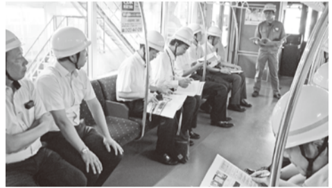
… 車内での説明 …