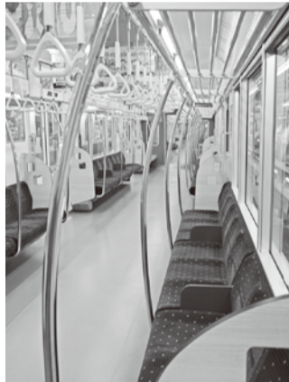
… 明るく開放的な客室 …