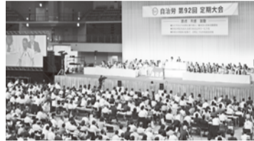
3000人を超える参加者が集まった