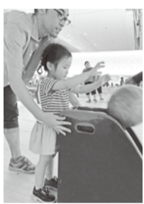
… お子さんも参加 …