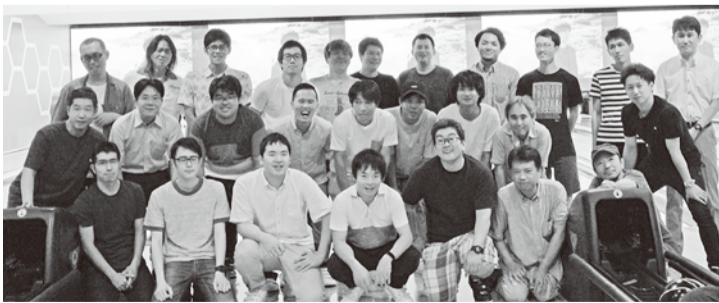
… 参加者全員で …