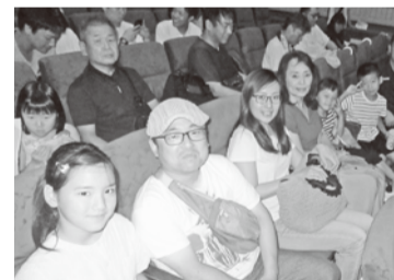
… 観客席で …