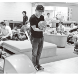
… 華麗なフォーム …