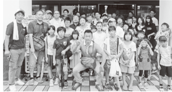
… 参加者全員で …