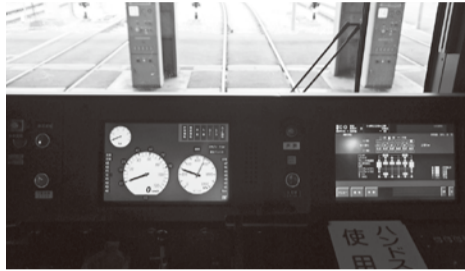
… 運転席の様子 …