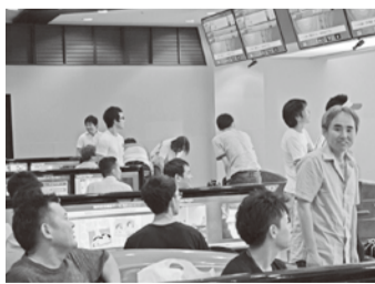
… ストライク連発! …