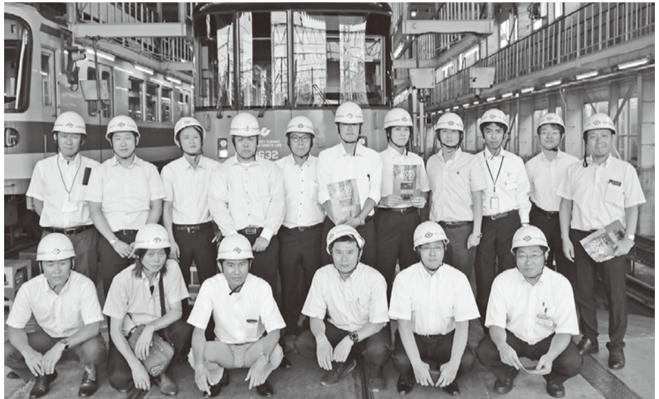
… 視察メンバーで …